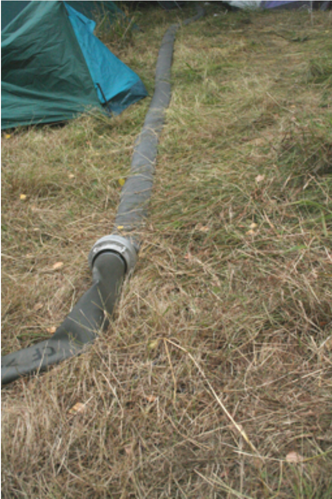
Brandslangen. Pladsmændenes foretrukne våben i kampen mod terrorister.