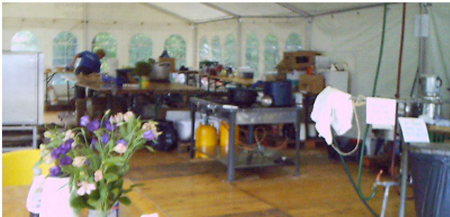
Køkkenet, stedet hvor unge mænd mister deres uskyld til fristerinden Spirituosa.